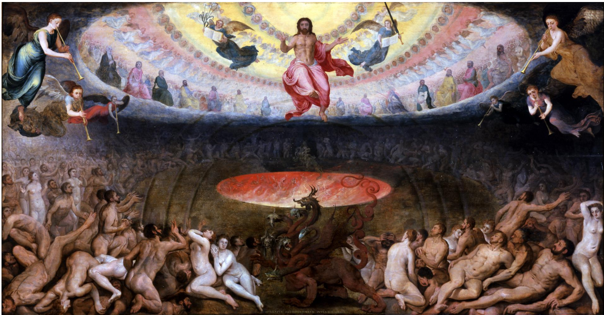
Hubertus Goltzius (1526-1583), Het Laatste Oordeel. Olieverf op paneel. Limburgs Museum.

Van: Limburgs Museum <info@limburgsmuseum.nl> Verzonden: woensdag 21 september 2022 09:53 Onderwerp: Uitnodiging: opening 'Mystiek'